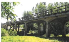
Pont de Dompierre