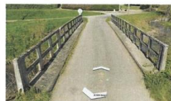
Pont de Paray