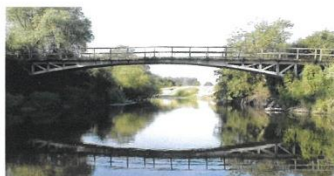
Pont de Prairéal