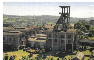
Le bâtiment de la mine et son chevalement, construit par Eugène Freyssinet un des premiers réalisés en béton armé (1923)