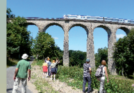
Viaduc de la Perrière