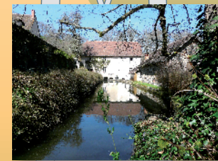
Moulin de Vilbonne

Coup de sifflet du chef de gare ! En voiture ! Mais aujourd'hui, c'est dans la cabine, au poste de conduite, que vous êtes conviés à faire le trajet de Commentry à Gannat. Le train démarre, le voyage commence : défilement des rails, admiration des paysages bucoliques du bocage bourbonnais, vide impressionnant au passage des viaducs, alternance du vert sombre des forêts et du vert tendre des prairies... Et bien sûr, un petit salut aux vaches qui regardent passer le train !