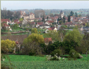
Bellenaves - Table d'orientation - Château de Bellenave - Eglise St-Martin (XIIe siècle)