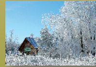
La Bosse : - Musée Wolframines - Site géologique - Parcours dans les arbres