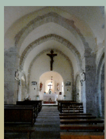
Eglise de Chirat-l'Église