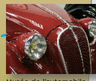
Musée de l'automobile