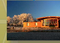
Village de vacances Le Vert Plateau - Départ de circuits VTT