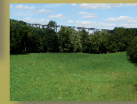
Vue sur le Viaduc de la Bouble