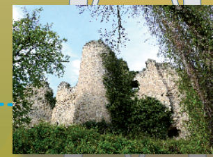
Naves - Table d'orientation - Ruines du château - Platane remarquable