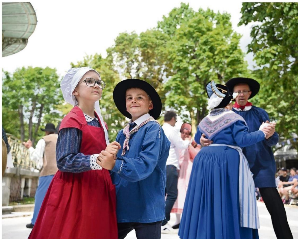
Les danses et musiques traditionnelles font partie du patrimoine bourbonnais à transmettre.